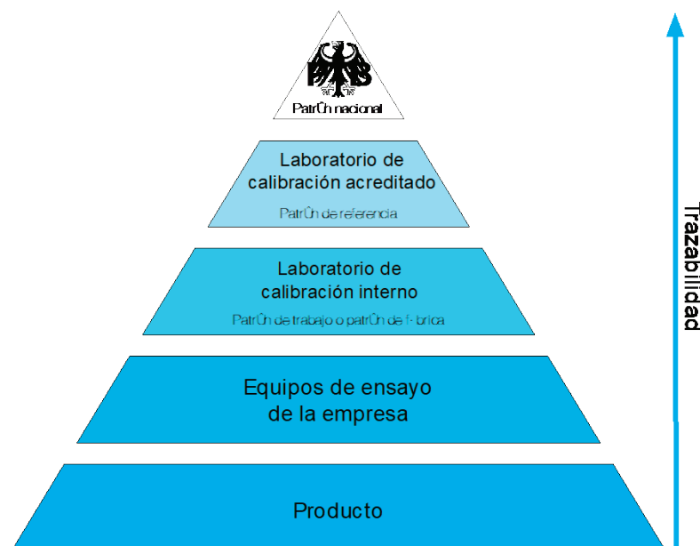
Jerarquía de calibración en la República Federal de Alemania

La infraestructura de la calidad ( metrología, normalización y acreditación ) se ve afectada en su totalidad por la digitalización; actualmente, los desafíos más importantes se observan en el campo de la normalización y la calibración, como parte metrológica de la acreditación. En la “Cumbre Nacional de la TI 2015”, se presentó, por lo tanto, el documento de posición „ Leitplanken für die digitale Souveränität “ (Límites para la soberanía digital) [37]; este documento especifica tres requisitos esenciales para mantener la competitividad: una infraestructura eficiente y segura, el dominio de competencias y tecnologías claves, así como un marco de la soberanía digital abierto a la innovación. En las tres áreas, se requiere una infraestructura de la calidad en su totalidad para garantizar la fiabilidad y confianza en la medición correcta. Por una parte, esto se refiere a la infraestructura de la comunicación en la que, en el futuro, la fiabilidad de las mediciones