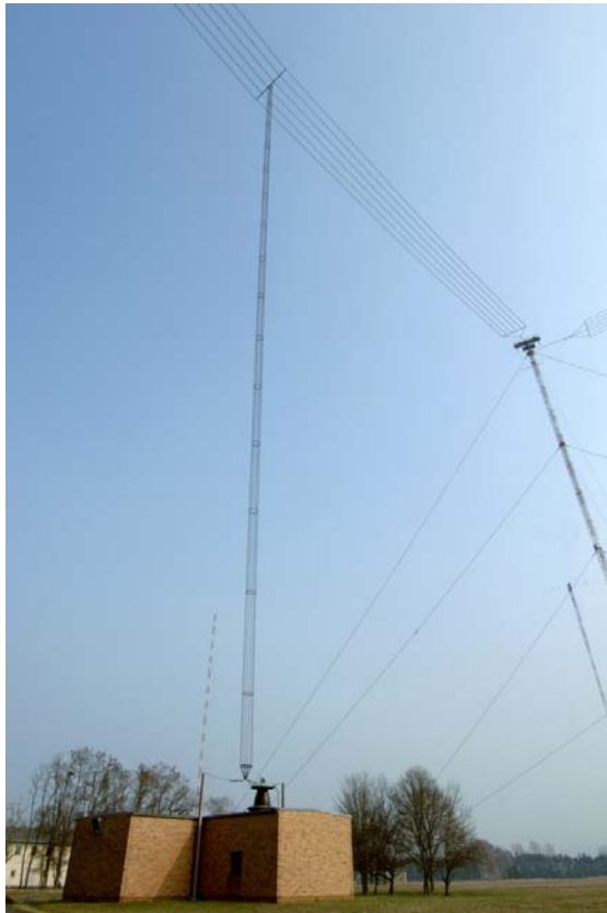
Bild 4 Antennenhaus mit darüber hängender Antenne des Langwellensenders DCF77.

von Funkuhren empfangen werden. In Bild 4 ist die 150 m hohe reusenförmige Sendeanenne zu sehen, die zwischen zwei Spannmasten aufgehängt ist.