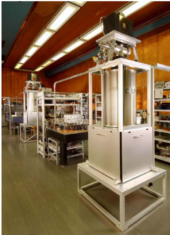
Bild 1 Ansicht der beiden Cäsium-Fontänenuhren CSF1 (hinten) und CSF2 (vorne) der PTB.

Zeitsignale. Auch wird Messtechnik benötigt, die eine Stabilitätsanalyse aller Uhren untereinander ermöglicht. Einige Zeitinstitute (vornehmlich die der großen Industrieländer) entwickeln und betreiben auch sog. primäre Cäsiumuhren. Das sind Uhren, die möglichst genau SI-Sekunden liefern und für die es zu jeder Betriebszeit eine Abschätzung der dabei auftretenden Unsicherheit gibt. Die besten Uhren dieser Art sind sogenannte Cäsium-Fontänenuhren. Mit ihnen ist es möglich die Sekunde bis auf 16 Stellen nach dem Komma genau zu realisieren. An der PTB werden zwei dieser Uhren verwendet, u. a. um Wasserstoffmaser in ihrer Frequenz für die Realisierung von UTC(PTB) wie zuvor beschrieben zu kalibrieren. In Bild 1 sind die beiden Fontänenuhren CSF1 und CSF2 zu sehen.