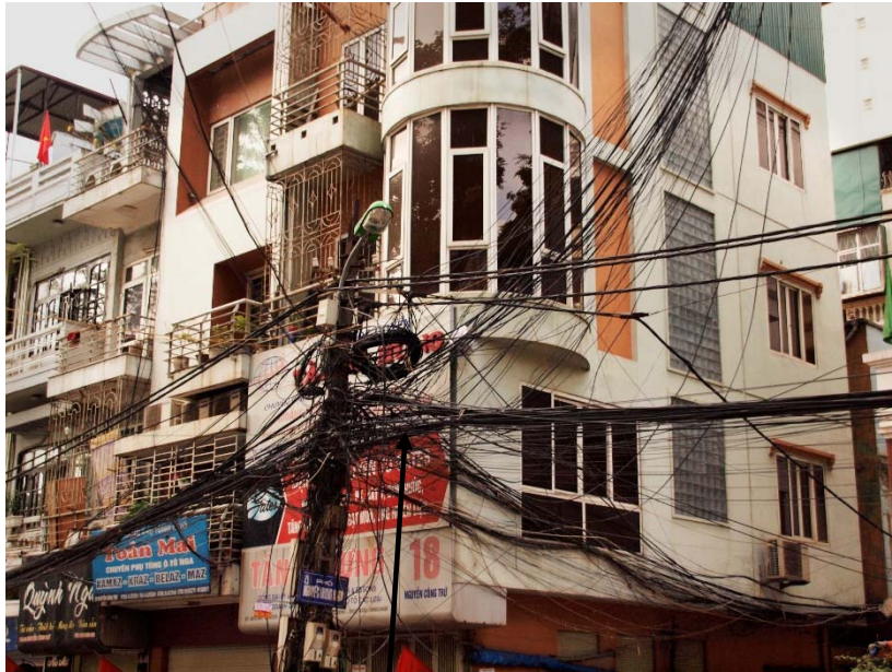
Jedem sein Kabel